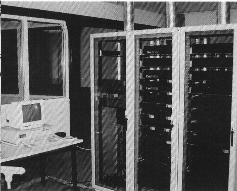
Het hart van de gecomputeriseerde zender: een batterij-video-recorders aangesloten op de computer.

Is hij niet bang voor zijn baantje? "Absoluut niet. Non-stop radio is een keuze, en dan is dit zeker de beste vorm. Op het moment dat een computer dingen kan doen die je zelf veel meer tijd zou kosten, dan ben je gek als je het niet