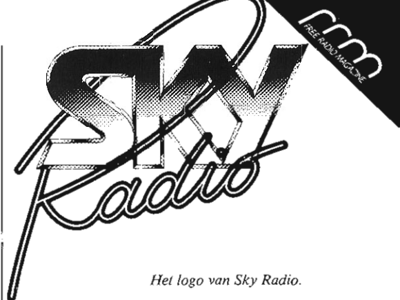
Het logo van Sky Radio.

Zoals eerder gezegd bestaan er reeds twee stations die via de satelliet commerciële radioprogramma's verzorgen. Ton Lathouwers ziet dat echter niet als concurrentie. "Je moet je realiseren dat